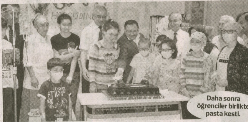
Daha sonra öğrenciler birlikte pasta kesti.