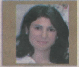
TEŞVİK ÖDÜLÜ Sosyal Bilimler