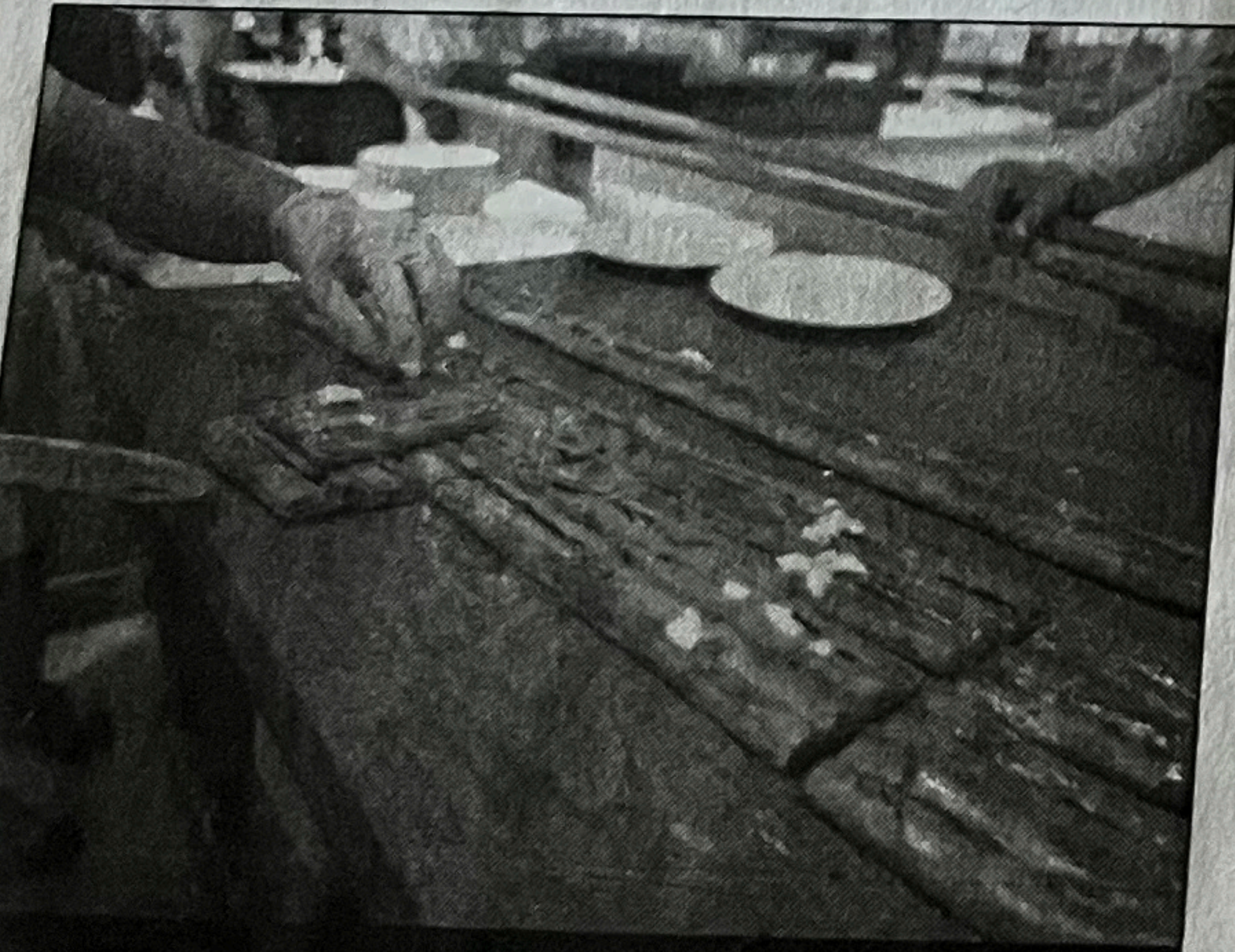
Dünyanın en iyi ekmeği olarak seçilen Bafra pidesi Samsun'un tanıtıma uluslararası anlamda büyük fayda sağladı

Toplantıda dünyanın en iyi ekmeği olarak seçilen ve Samsun'un tanıtıma uluslararası anlamda büyük fayda sağlayan Bafra pidesinin yanına bu coğrafi işaretli ürünlerinin eklenmesinin Samsun'un gastronomi turizminden daha da öne çıkmasına fayda sağlayacağı belirtildi. İHA