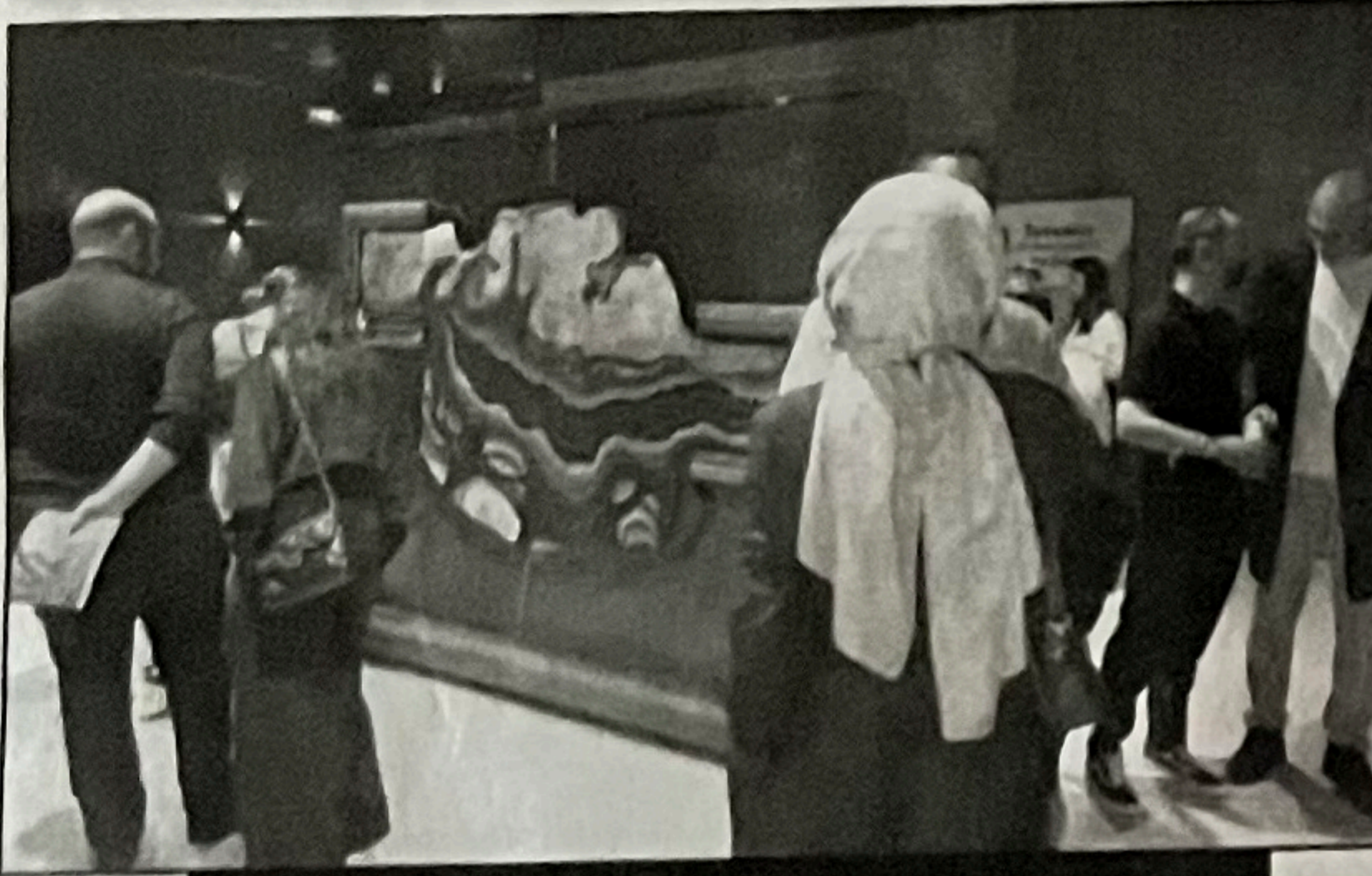
Sanatçının özgün içerikli tuval üzerine yağlı boya resim çalışmalarının sergilendiği etkinlik, sanatseverlerin büyük beğenisini topladı